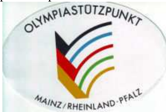
3 Jahre Sportphysio-Coatch – Olympia Stützpunkt Grenzau/Tischtennis...