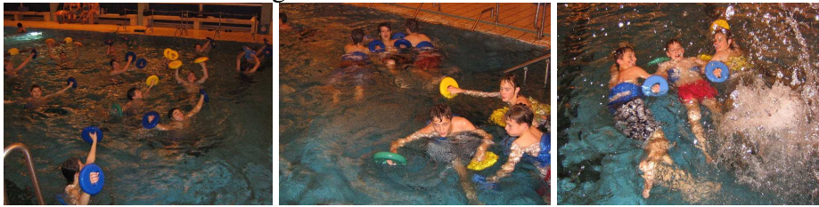
Die Fußballer der Eintrach-Glas-Chemie Wirges beim AquaSPORT...