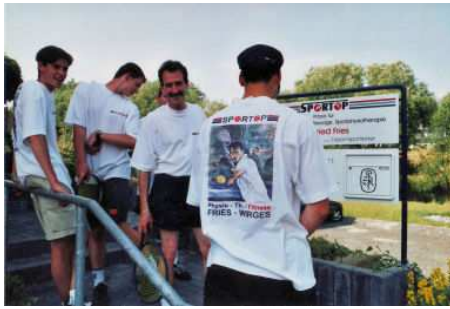
Tennisclub Staudt bei SPORTOP-FRIES